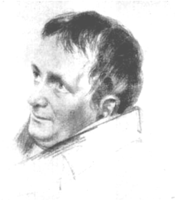
Tieck , esquisse par Franz Krüger, Berlin, 1840.

Au moment où Tieck rencontra Novalis (1772-1801), deux ans avant la mort du jeune poète, celui-ci n'était plus l'adolescent fantaisiste et pétulant qu'a dépeint Frédéric Schlegel en 1792 3 . Sa personnalité s'était accentuée, la douleur l'avait mûri, et depuis la mort de sa fiancée, il vivait dans cette douce extase qui fait de lui le poète le plus mystérieux du premier romantisme allemand.